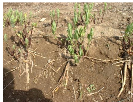
図2 畦が崩れ根が露出した株