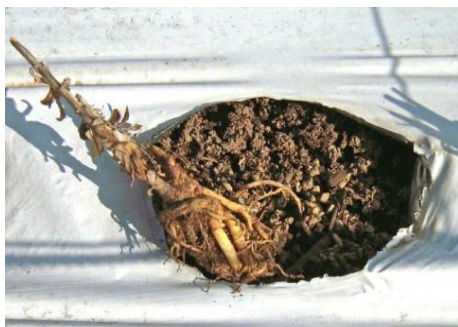
図1 冬期間に浮き上がった株

マルチを除去している圃場では、畦の肩部分が崩れて根が露出することがあります。生育への影響が懸念されるので、早めに土を寄せ補修して根やクラウン部を保護しましょう。