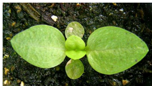
図3 本葉2対目の出始め(薬剤防除時期) ※子葉に苗腐敗症発生

育苗期に発生するアルタナリア菌による苗腐敗症は、種皮に付着した病原菌が伝染源となり、子葉で発病した後、本葉に伝染します。適用殺菌剤による種子消毒に加えて、本葉2対目が出始める時期に薬剤散布することで、以降の病勢進展を抑制します。