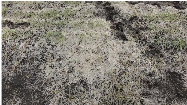
写真1 雪腐褐色小粒菌核病の被害圃場

一方、現在はフロンサイド SC といった根雪前 4 週間程度から散布できる薬剤も登場してきています。雪腐病常習地で、根雪前の適期散布が困難な地域については特に有用と考えられます。詳細な使用方法については最寄りの農業改良普及センターなどに御相談ください。