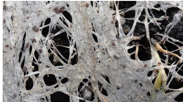
写真2 雪腐褐色小粒菌核病の拡大写真