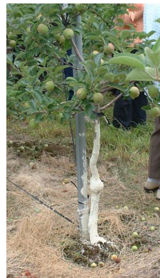
図1 ホワイトンパウダーを樹に塗布した状態

近年、冬季の気温が高く推移した後に急激に寒さが戻ることが多くなっています。凍寒害の心配のある園地では、若木を中心に地際部から高さ50cm程度まで、ホワイトンパウダー（図1）や水性ペンキ（白色）を塗布するか、わらを巻くなどして被害の軽減を図りましょう。