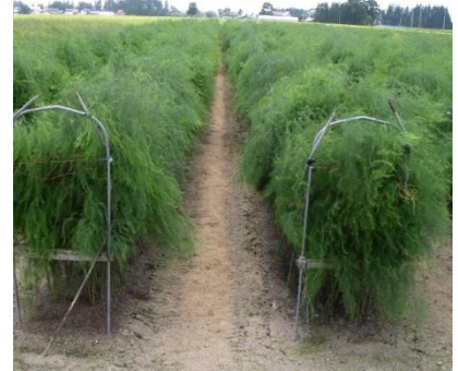
写真1 フラワーネット利用による倒伏防止例

促成アスパラガスの株養成においても、茎葉部を健全に保つことが収量向上につながります。病虫害防除を徹底し、倒伏させずに自然に茎葉が黄化するようにしましょう。