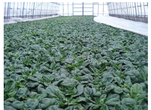
写真1 寒締めほうれんそうはハウスの開け閉めによる温度管理が重要

収穫は、平たく開張したもので、最大葉の葉柄の絞り汁のBrix糖度が8%以上になっていることを確認してから行いましょう。