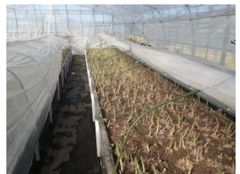
写真2 促成アスパラガスは萌芽開始後太陽光に当てて着色を促す

収穫は、規格に達した若茎から順次収穫を行います。茎の長さが30cm程度に伸びてから収穫し、先端から27cmに切り揃えます。曲がりや開き、細茎などの販売不能な茎は、エネルギーの消耗を防ぐため、早めに切り取って処分しましょう。