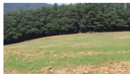
写真1 雑草を生え揃わせて除草剤散布

※ 除草剤散布から鎮圧まではできる だけ期間を空けずに進めます。 面積と時間を考慮の上、作業計画をた てましょう。