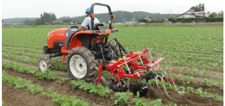
写真1 農業研究センター開発の改良型ディスク中耕除草機