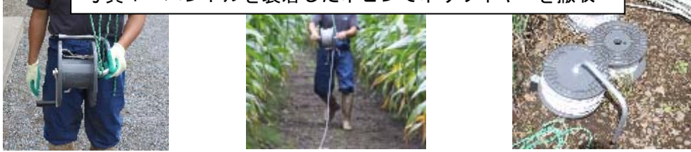
写真1 ハンドルを装着したポビンでポリワイヤーを撤収

ワイヤーを巻き取るポビン、巻き取りハンドルを準備 しておくと撤収時の軽労化が図れるだけでなく、次年度のワイヤー張り作業をスピーディに行うことができます（写真1）。ポビン、巻き取りハンドルについては各種電牧メーカーにお問い合わせ下さい。