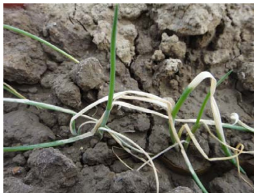
図3 ねぎの凍霜害事例

ハウス栽培の果菜類はトンネル等により低温障害を回避しますが、急激な温度上昇による高温障害にも留意し、早目に開放しましょう。