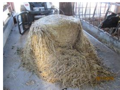
10月 和牛繁殖牛に給与