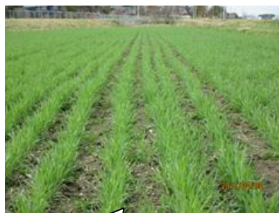
4月 消雪後の生育状況