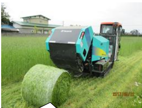
5月 イネWCS収穫専用機にて収穫