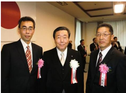
森山農林水産大臣とパチリ！！