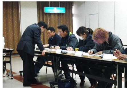
経営内容を書き出す若手生産者