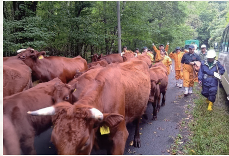
現地事例研究 (県農業研究センターなど)