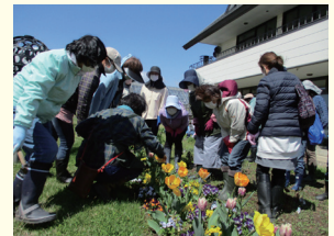
花きふれあい研修