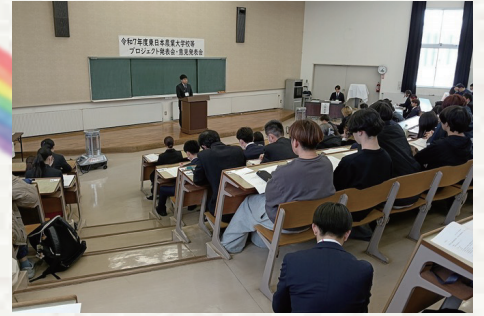
東日本農大等意見発表会