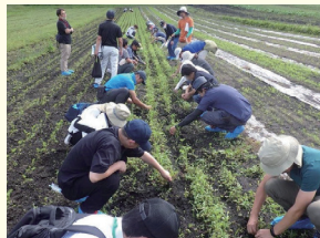
いわてグリーン農業アカデミー