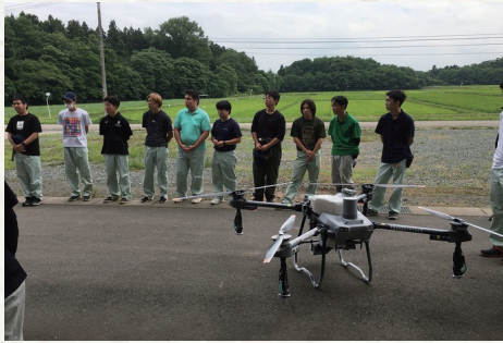
専攻実習 (ドローンによる農薬散布など)