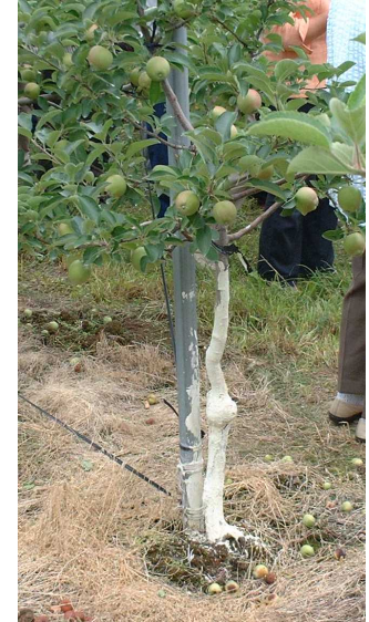
図3 ホワイトンパウダーを塗布した状態

近年、冬季の気温が非常に低く経過することが多くなっています。凍寒害の心配のある園地では、若木を中心に地際部から高さ50cm程度まで、ホワイトンパウダー（図3）や水性ペンキ（白色）を塗布するか、わらを巻くなどして被害の軽減を図りましょう。