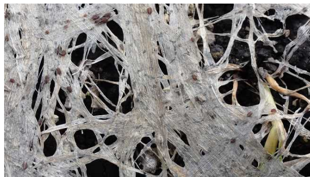
写真2 雪腐褐色小粒菌核病の拡大写真