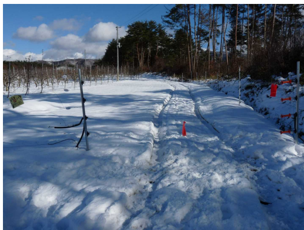
図2 フェンシングワイヤー電気柵の冬季の運用状況