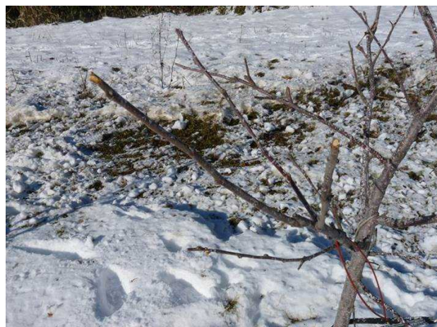
図1 ニホンジカによる芽の食害

廃棄果実は、地中深く埋めるか破砕するなどの処理を実施し、獣害の発生しづらい園地環境をつくるようにこころがけましょう。