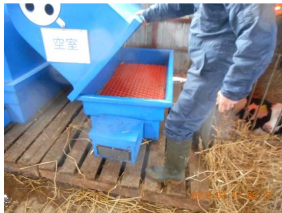
写真1、2 カーフウォーマー