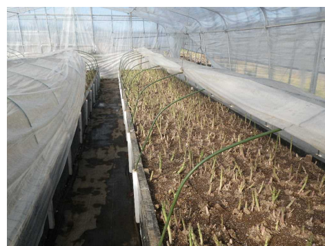
写真 2 促成アスパラガスは萌芽開始後太陽光に当てて着色を促す

収穫は、規格に達した若茎から順次収穫を行います。茎の長さが 30cm 程度に伸びてから収穫し、先端から 27cm に切り揃えます。曲がりや開き、細茎などの販売不能な茎は、エネルギーの消費を防ぐため、早めに切り取って処分しましょう。