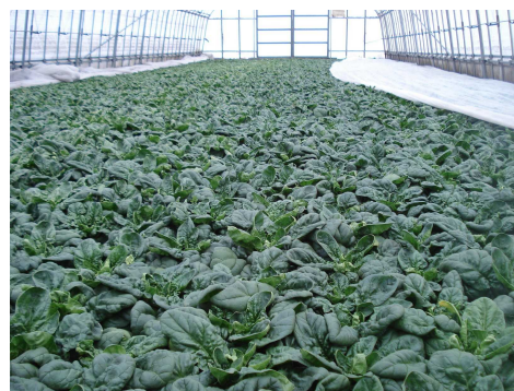
写真 1 寒締めほうれんそうはハウスの開け閉めによる温度管理が重要

収穫は、平たく開張したもので、最大葉の葉柄の絞り汁の Brix 糖度が 8%以上になっていることを確認してから行いましょう。