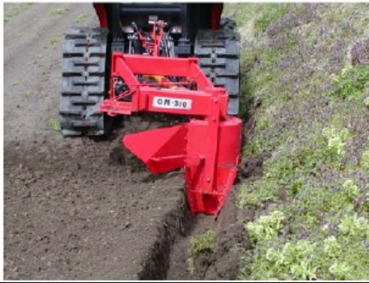
写真1 排水溝（額縁明渠）の設置 排水溝への集水は耕起土層からの流出が多いので、排水溝は耕起深より少なくとも5～10cmは深く掘ることが必要。

水稻の収穫後、小麦を作付けする圃場については、必要に応じてサブソイラによる弾丸暗渠の施工を行うとともに、地表水の速やかな排水を促すため、できるだけ早く額縁明渠を設置しましょ。う(写真1)。額縁明渠は必ず排水路につなげて下さい(写真2)。