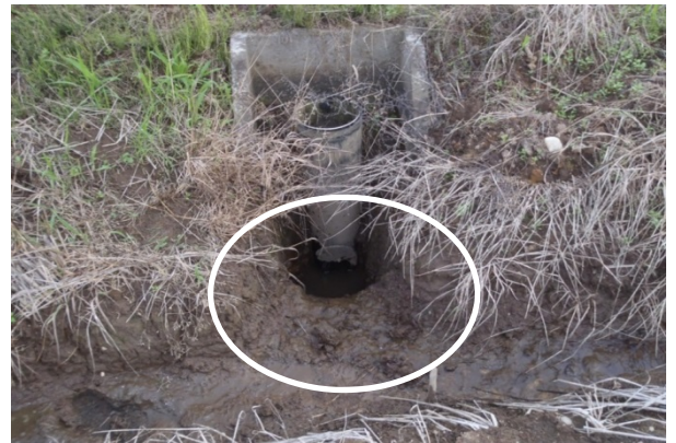
写真2 排水口の掘り下げ 水尻は大きく掘り下げ、排水溝とつなげ、フリードレーン下部から排水。

明渠のうち圃場内小明渠(写真3)は、播種後に施工が可能です。小麦を潰してしましますが、収量への影響はほとんどありません。