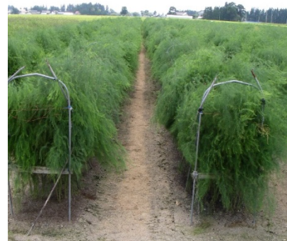
写真1 フラワーネット利用による倒伏防止例

倒伏防止対策をしている場合は、台風等に備えてもう一度ネットや誘引線の確認を行いましょう（写真1）。