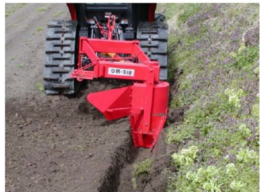
写真2 溝堀機による明渠の設置