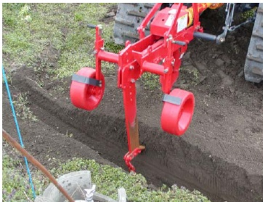
写真1 弾丸付サブソイラでの施工