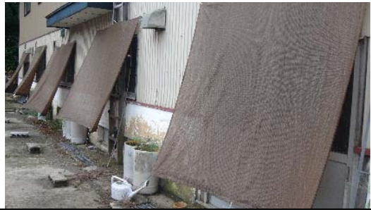
窓から直射日光が入るのを防止

暑熱対策として、飲水量を確保することも大切です。十分な飲水量を確保するため、配管を太くすることや、ウォーターカップを改修することも検討しましょう。また、水槽のこまめな清掃も飲水量確保に有効です。