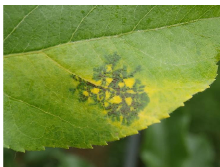
図2 褐斑病の病斑（黒色虫糞状の粒々が特徴）