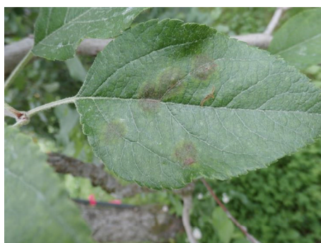
図1 黒星病の病斑（病斑部は古くなると隆起する）