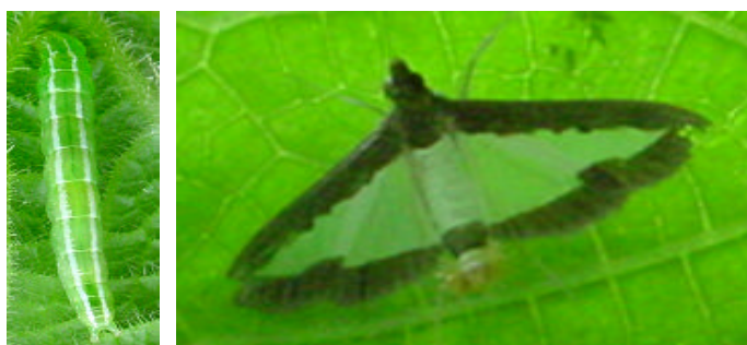
写真 ワタヘリクロノメイガ(左:幼虫、右:成虫)

(2) 若齢幼虫はヨトウガに似ているが、中齢幼虫では背面に白い2条の線があるので区別できる（写真参照）。