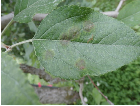
図2 黒星病の病斑（病斑部は古くなると隆起する）