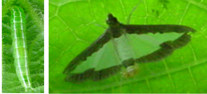
写真 ウリノメイガ(左:中齢幼虫、右:成虫)

(2) 若齢幼虫はヨトウガに似ているが、中齢幼虫では背面に白い2条の線があるので区別できる（写真参照）。