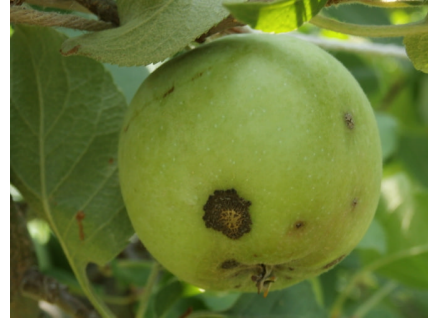
図3 黒星病の果実病斑