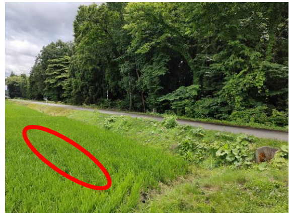
写真2 圃場内の発生箇所 日陰(円内)で発生確認