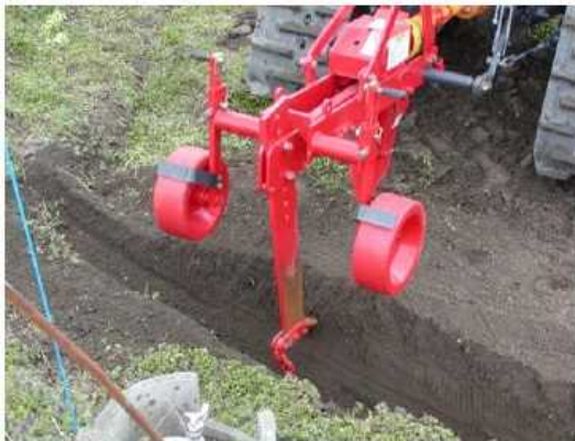
写真1 弾丸付サブソイラでの施工