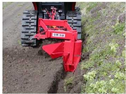
写真2 溝堀機による明渠の設置