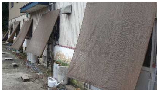
窓から直射日光が入るのを防止