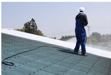
牛舎屋根への石灰塗布

屋根に当たった日光による輻射熱で牛舎内の温度が上昇します。遮熱塗料やドロマイト石灰などを屋根に塗布することで、輻射熱を低減させられます。また、寒冷紗等で西日を遮ることも有効です。(1時間の西日は体温を10°C上昇するだけのエネルギーがあります)