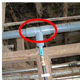
配管を太くすることで一度に十分な水量を供給できます。