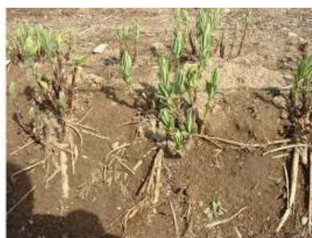
写真2 畦が崩れて根が露出した株