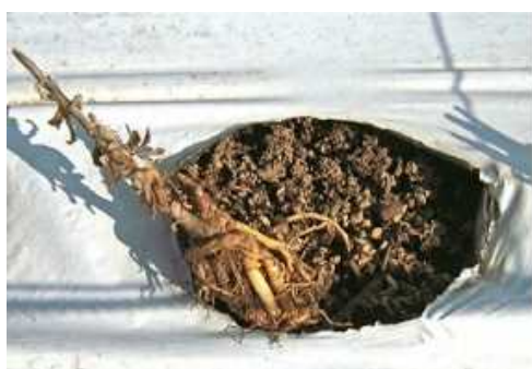
写真1 冬期間に浮き上がった株

マルチを除去している圃場では、畦の肩部分が崩れて根が露出することがあります（写真2）。そのままでは生育への影響が懸念されるので、早めに土寄せを行い根やクラウン部を保護します。