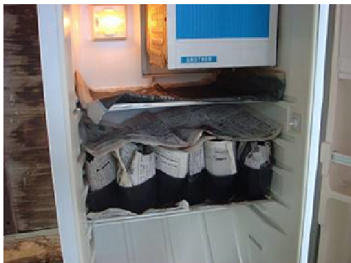
写真4 家庭用冷蔵庫を利用した穂冷蔵