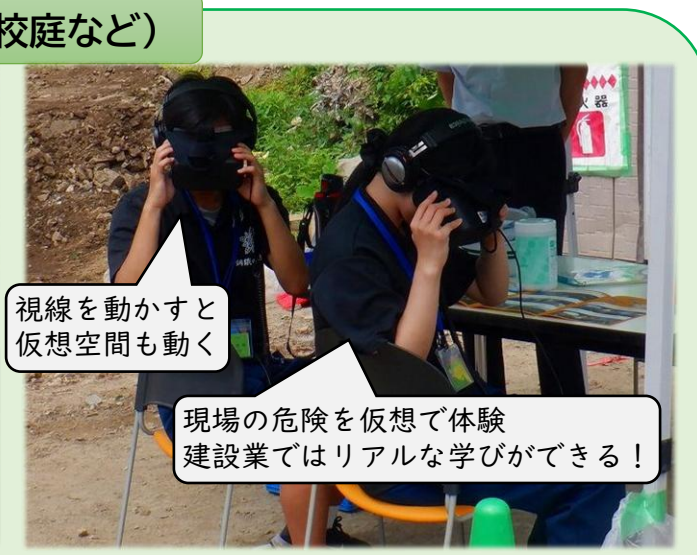
VRによる建設現場体験