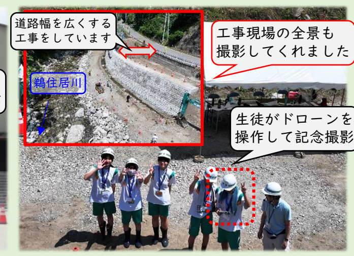
ドローン操作体験