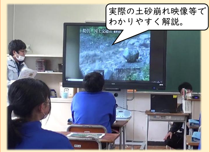
土砂災害について学習