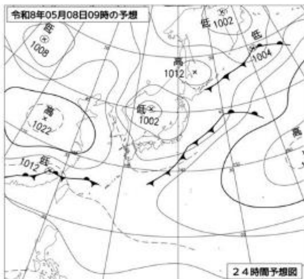
5月8日 09時 の予想天気図

8日の大槌町での最大風速は、西よりの風8メートルの見込みで、瞬間的に2倍程度の風が吹く場合があります。