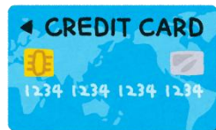
クレジットカード決済