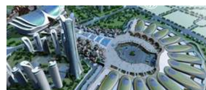
昆明滇池国際会展センター