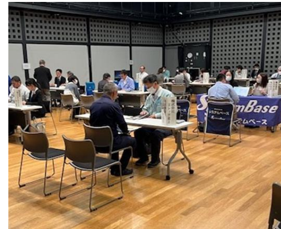
北上地区就職相談会 (R7.10月)