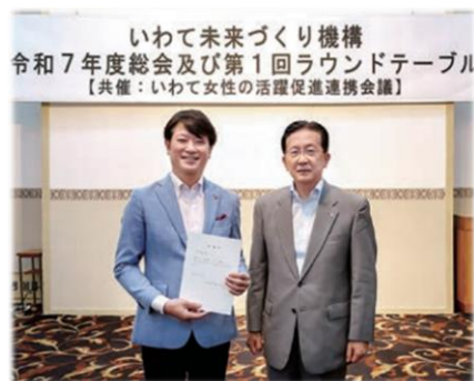
いわて女性活躍アドバイザー委嘱 (R7.7.11)

企業や地域等における固定的性別役割分担意識の解消に向け、外部専門人材を「いわて女性活躍アドバイザー」に委嘱し、経済団体等を対象にアンコンシャス・バイアスへの気づきを促す講演会を実施