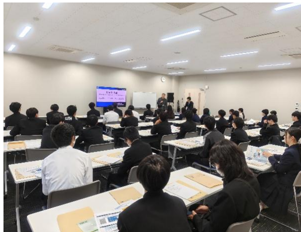
盛岡第一高校企業見学会 (R7.11月)