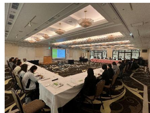
県男女共同参画センターによる出張セミナー (R7.12.23)