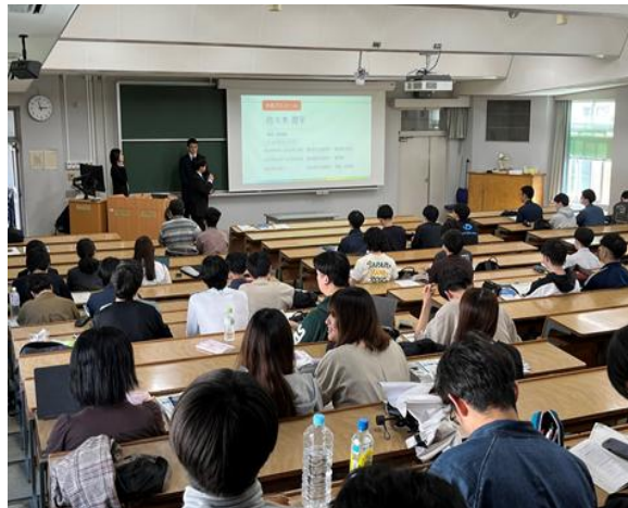
岩手大学理工学部キャリア講座 (R7.5月)