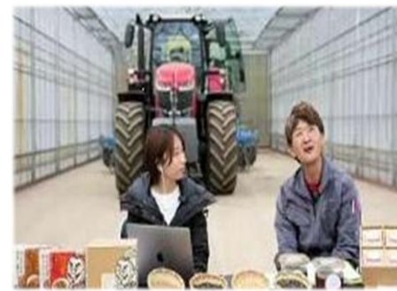
リモート就農体験ツアー