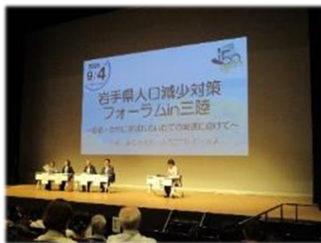
人口減少対策フォーラムin三陸 (R7.9.4)