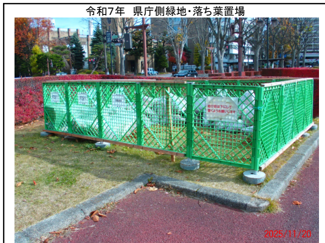
令和7年 県庁側緑地・落ち葉置場