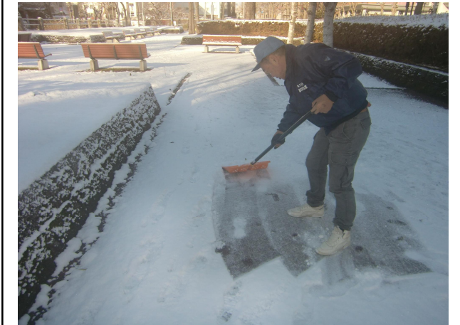
令和7年 管理作業・除雪