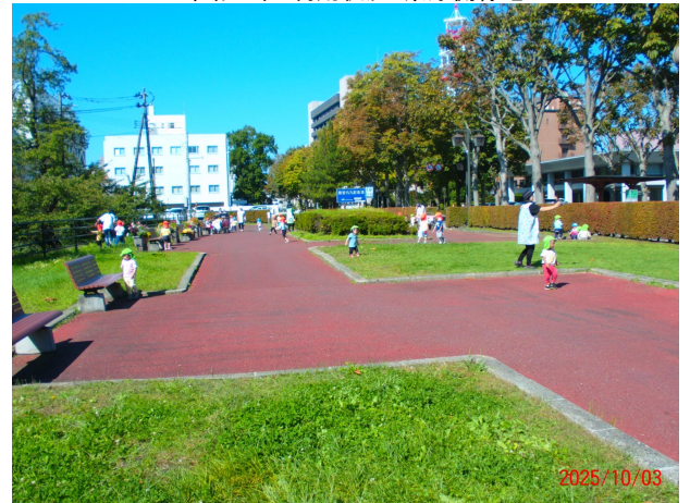
令和7年 利用状況・県庁側緑地