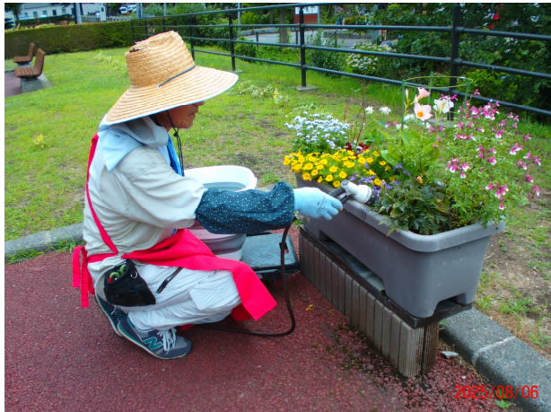
令和7年 園芸クラブみどり・男性会員・プランターへの水やり