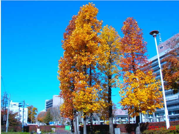
令和7年 ユリノキ(内丸緑地内)