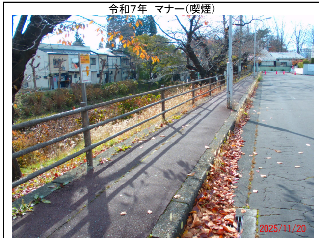
令和7年 マナー(喫煙)