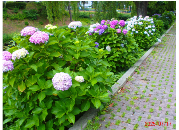
令和7年 近隣のアジサイ