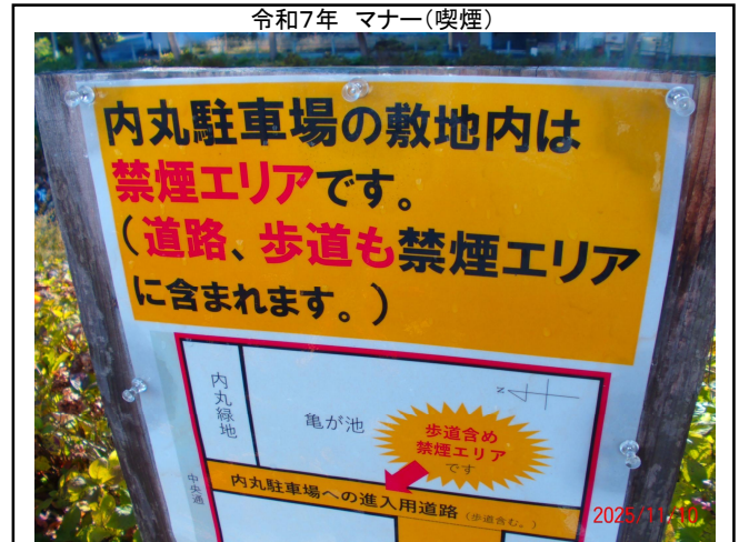
令和7年 マナー(喫煙)