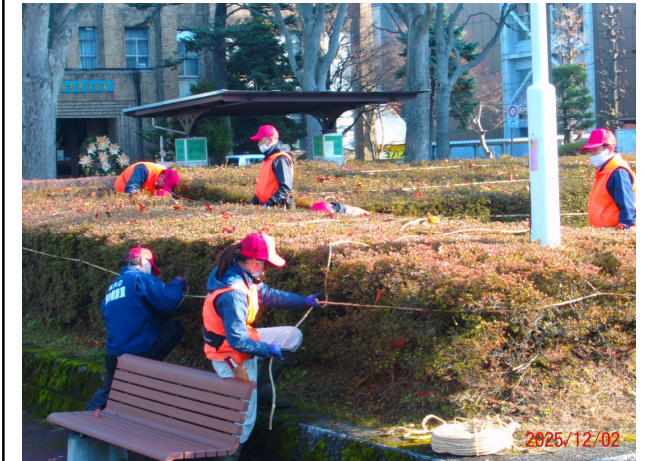
令和7年 管理作業・低木雪囲い