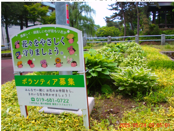
令和7年 花壇・園芸クラブみどりボランティア募集