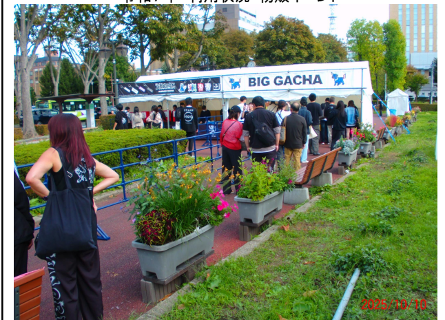
令和7年 利用状況・物販イベント