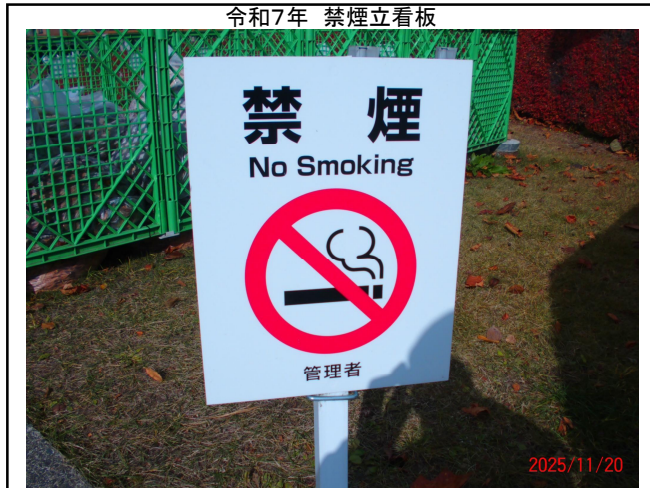
令和7年 禁煙立看板