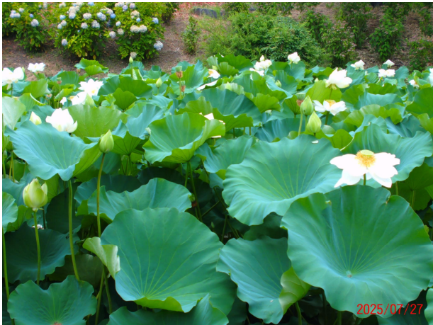
令和7年 近隣のハス