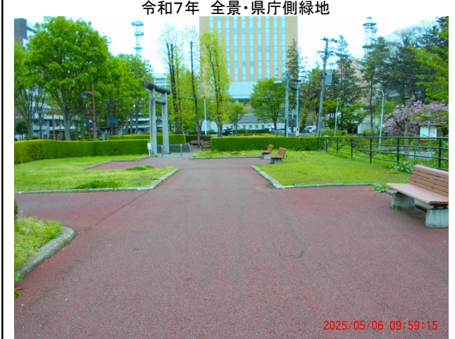
令和7年 全景・県庁側緑地