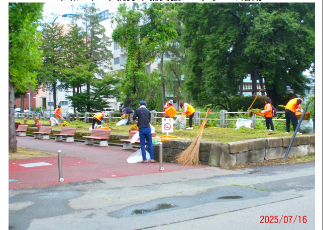
令和7年 市就労準備支援プログラムの活動