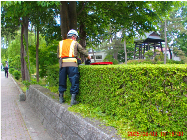
令和7年 管理作業・生垣剪定