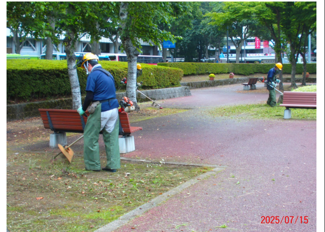
令和7年 管理作業・草刈り