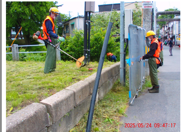
令和7年 管理作業・草刈り