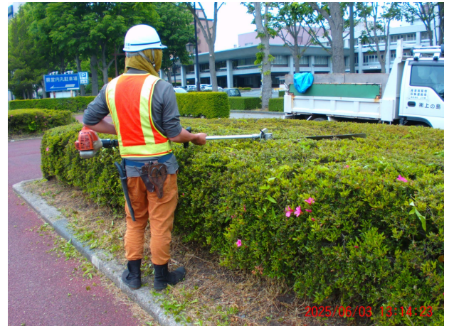
令和7年 管理作業・生垣剪定