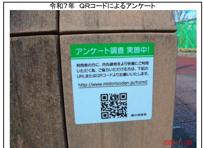
令和7年 QRコードによるアンケート