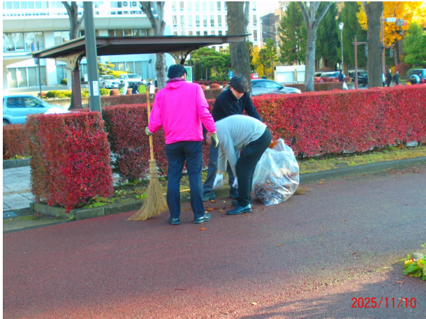
令和7年 近隣職場からのボランティア