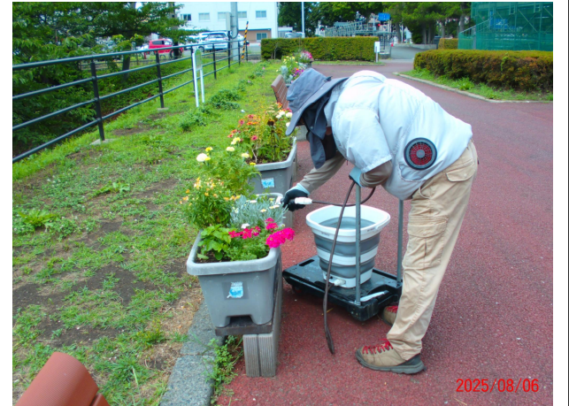
令和7年 プランターへの水やり