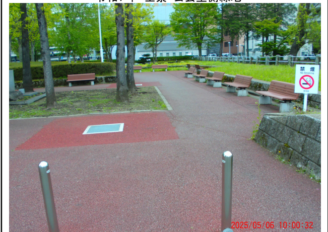
令和7年 全景・公会堂側緑地