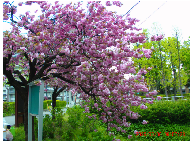
令和7年 近隣の八重桜