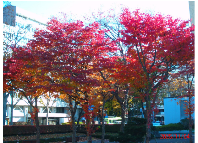
令和7年 ヤマボウシ(内丸緑地内)