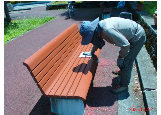
令和7年 管理作業・ベンチ拭き掃除