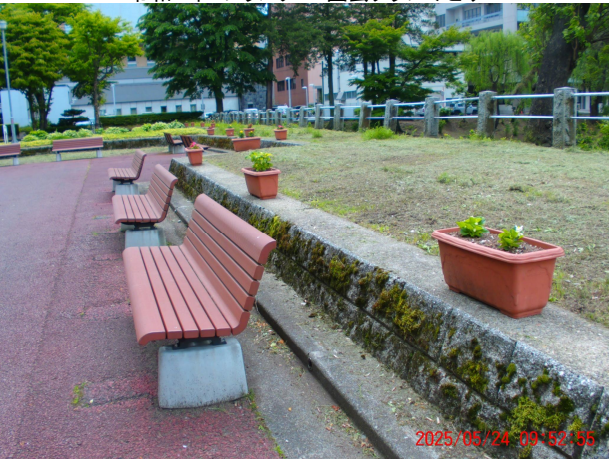
令和7年 プランター・園芸クラブみどり