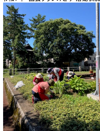
令和7年 園芸クラブみどり・活動状況