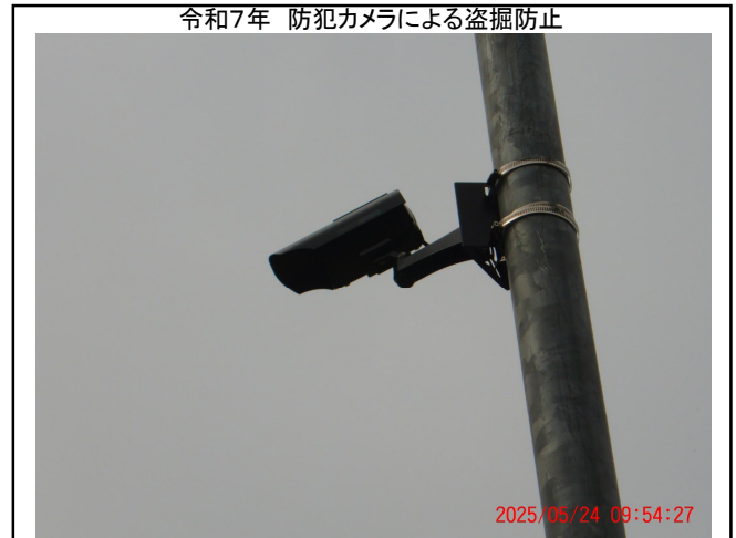
令和7年 防犯カメラによる盗掘防止