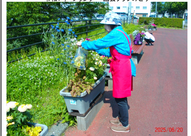
令和7年 プランター・園芸クラブみどり