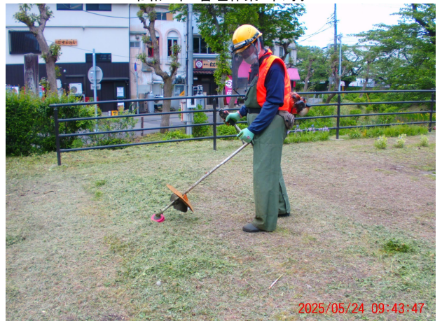
令和7年 管理作業・草刈り