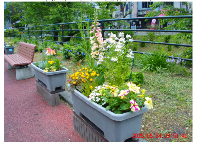
令和7年 プランター・園芸クラブみどり