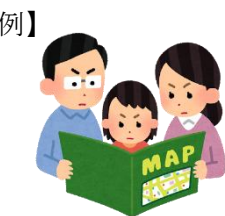
防災マップで避難場所 や避難経路を確認