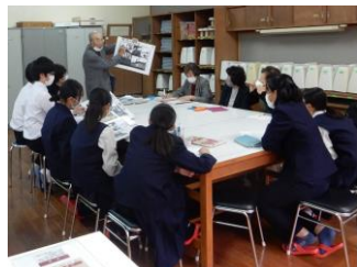
中学生とのグループ学習（宮崎県）