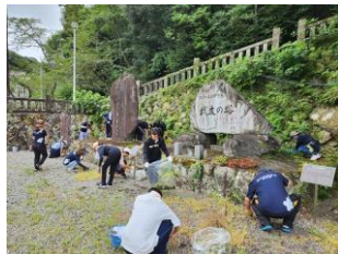
高校生との慰霊碑清掃（高知県）