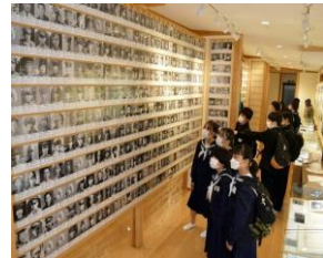
県戦没者記念館で平和学習をする中学生（徳島県）