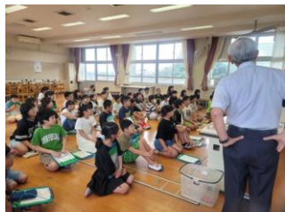
小学生への講話（佐賀県）