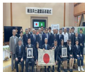
戦没者の遺留品返還式（鳥取県）