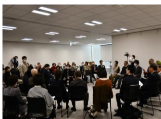
体験者と次世代が記憶の伝承について話し合う（本部）