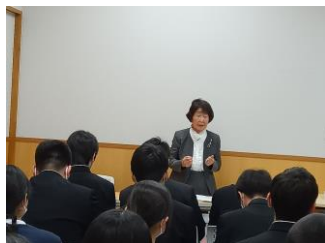
中学生への講話（岡山県）