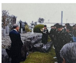
慰霊碑の前で語り部（静岡県）