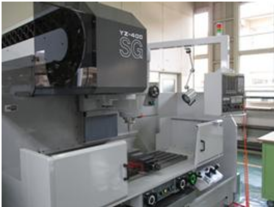
マシニングセンタ

主に切削加工と研削加工と呼ばれる手法で作られます。 切削加工の代表的な機械は「マシニングセンタ」で、研削加工は「平面研削盤」です。「マシニングセンタ」は数 mm～0.001mm、平面研削盤は 0.01mm～0.0001mm の加工ができます(髪の毛の太さは 0.01mm 程度)。機械の操作は特別難しいわけではなく、6 か月ぐらいで誰でも自由に使えるようになりますが、精度を上げた加工技術の取得には時間がかかります。