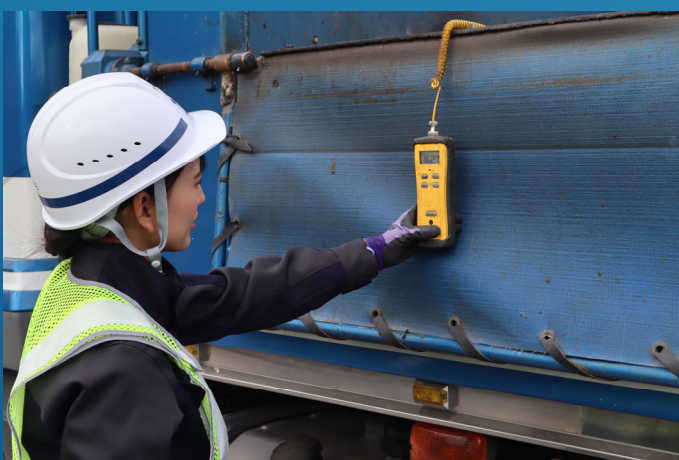
アスファルト到着温度の測定