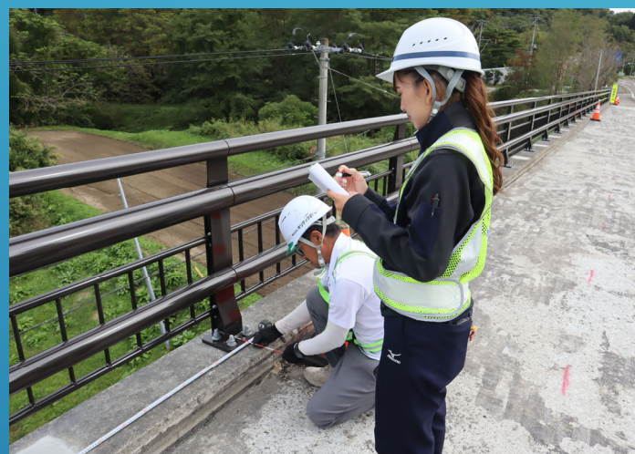
高欄の出来形管理

建設業が女性でも働きやすい環境、活躍できる場であること、会社で仕事と育児の両立がしやすいことを知り選びました。