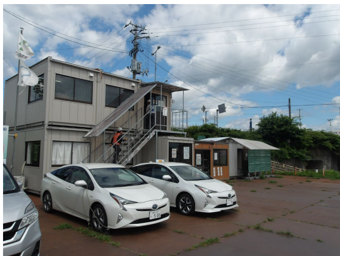
現場事務所（1 階がクーリングシェルター）