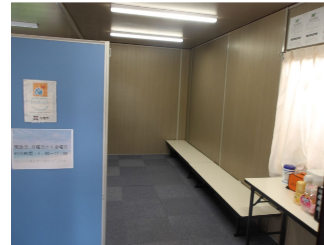
現場事務所 右側がクーリングシェルター