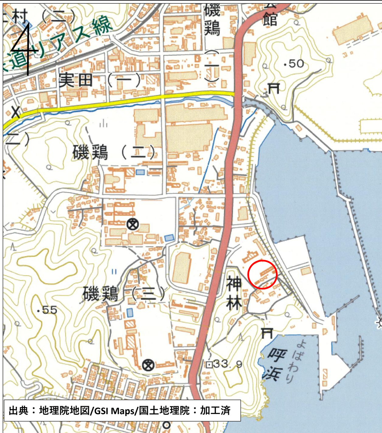
位置図（宮古市神林45番66及びび45番100）