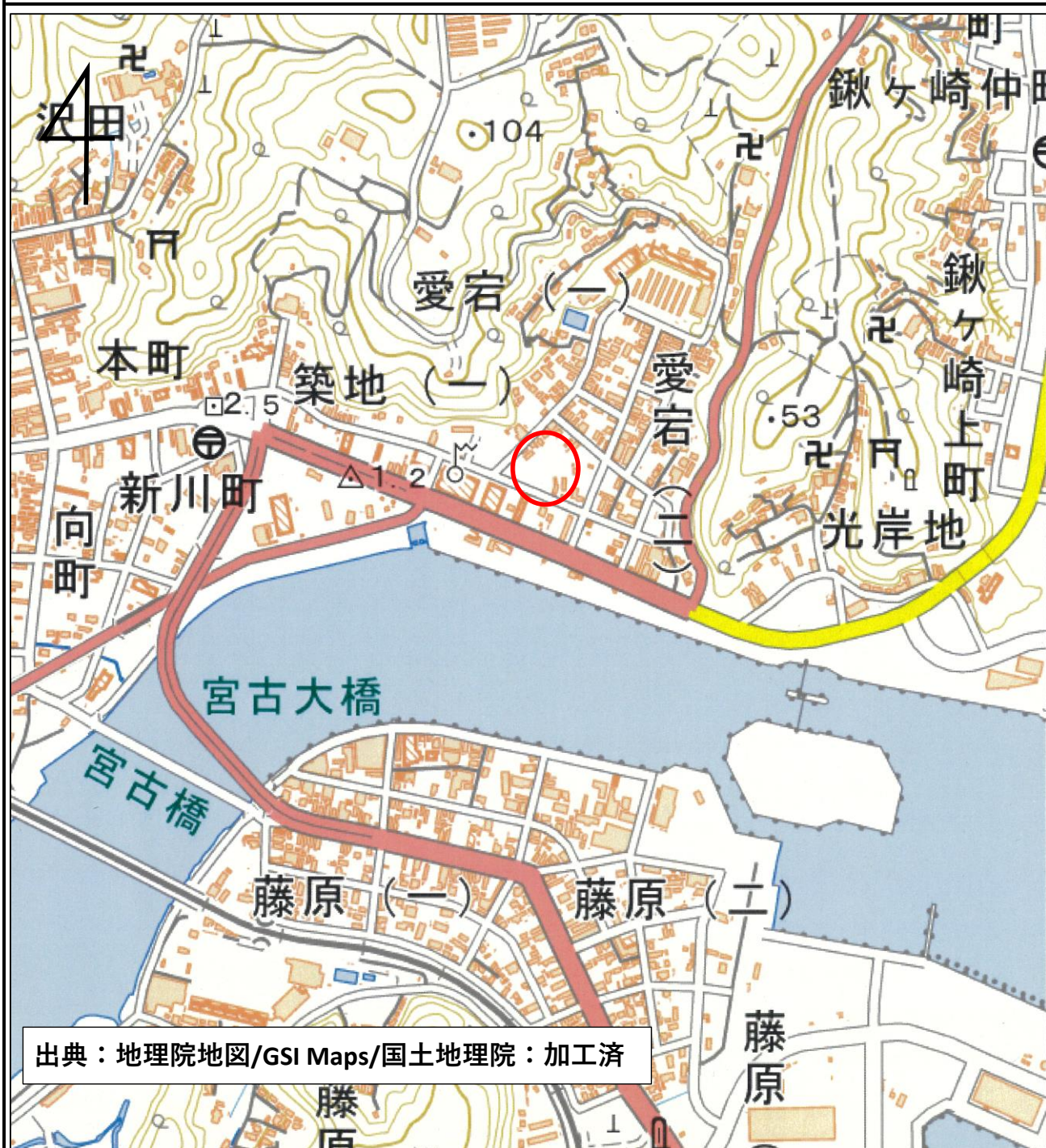
位置図（宮古市築地二丁目88番5）