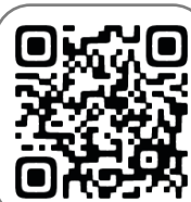
参加申込フォーム

※参加申込フォーム https://forms.gle/VPHdYAL2L8sm4TWq8