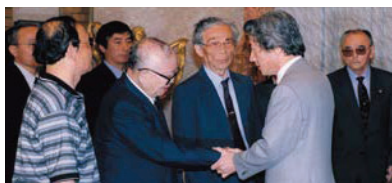
控訴断念するか否かの最終判断をする直前に、ハンセン病訴訟原告代表と面談する小泉内閣総理大臣(当時)

熊本地裁の判決に対し、国は控訴※断念を決めるとともに、内閣総理大臣談話を発表し、ハンセン病問題の早期解決に取り組む決意を表明しました。しかし判決後も、熊本県で入所者に対するホテル宿泊拒否事件が起き、これが報道されると、今度は元患者に対する誹謗中傷が行われる事態に発展するなど、残念ながら入所者や社会復帰者、その家族に対する偏見や差別には根強いものがあります。そのため、療養所の外で暮らすことに不安を感じ、安心して退所することができないという人もいます。