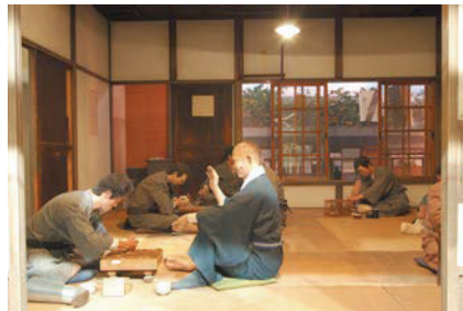
昔の療養所の暮らしが再現されています

〒189-0002 東京都東村山市青葉町4-1-13 電話 042-396-2909 URL https://www.nhdm.jp/