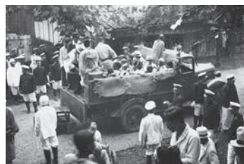
患者の収容には警察官が立ち会った

19世紀後半、ハンセン病はコレラやペストなどと同じような恐ろしい伝染病であると考えられていました。当初は、家を出て各地を放浪する患者が施設に収容されましたが、やがて自宅で療養する患者も収容されるようになりました。ハンセン病と診断されると、市町村や療養所の職員、医師らが警察官を伴ってたびたび患者のもとを訪れました。そのうち近所に知られるようになり、家族も偏見や差別の対象にされることがあったため、患者は自ら療養所に行くしかない状況に追い込まれていったのです。このような状況のもとで、昭和6年（1931年）にすべての患者の隔離を目指した「癩予防法」が成立し、療養所の増床が行われ、各地にも新しく療養所が建設されていきました。また、各県では「無癩県運動」という名のもとに、患者を見つけ出し療養所に送り込む施策が行われました。保健所の職員が患者の自宅を徹底的に消毒し、人里離れた場所に作られた療養所に送られていくという光景が、人々の心の中にハンセン病は恐ろしいというイメージを植え付け、それが偏見や差別を助長していったのです。