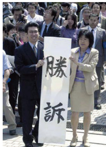
熊本地裁での勝訴発表

熊本地裁判決の日に 原告が勝訴の感動を綴った詩 太陽は輝いた 90年、長い長い暗闇の中 一筋の光が走った 鮮烈となって 硬い殻を砕き 光が走った 私はうつむかないでいい みんなと光の中を 胸を張って歩ける もう私はうつむかないでいい 太陽は輝いた