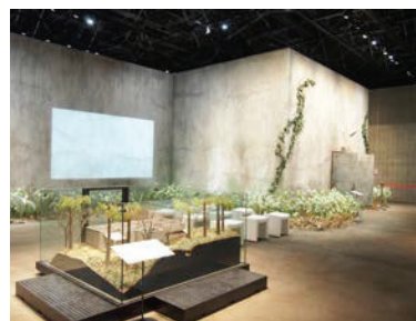
縮尺1/20の模型(手前)と実寸大で部分再現された重監房

また、ガイダンス映像や証言ビデオなどの映像が見られるほか、歴史パネルや実物資料を展示したコーナーなどがあります。