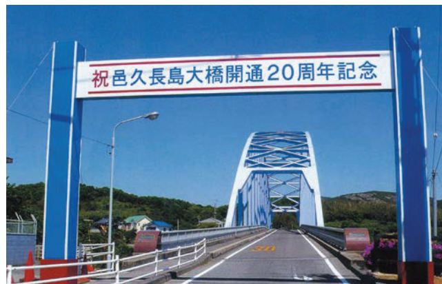
人間回復の橋と呼ばれる邑久長島大橋

長島と対岸の虫明を結ぶ邑久長島大橋は、1988年(昭和63年)に開通しました。隔離する必要のない証、人間回復の証として架橋され、現在は民間バスも乗り入れ、入所者も自由に島外に出かけられるようになっています。