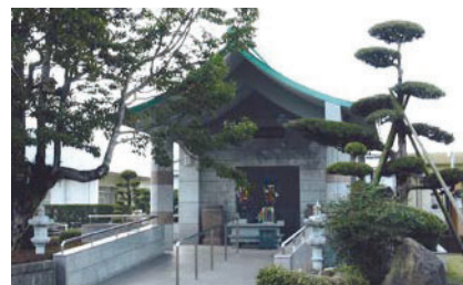
星塚敬愛園の納骨堂

高齢や後遺症、周囲の偏見などを乗り越えて、療養所を退所して社会復帰した人もいますが、その数は決して多いとはいえません。療養所に入所したときに、家族に迷惑が及ぶことを心配して本名や戸籍を捨てた人もいるため、現在も故郷に帰ることなく、肉親との再会が果たせない人もいます。療養所で亡くなった人の遺骨の多くが実家のお墓に入れず、各療養所内の納骨堂に納められています。