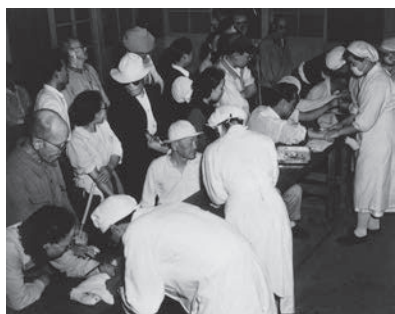
治療薬「プロミン」の注射

ハンセン病患者の隔離政策は、「癩予防法」という法律のもとで進められました。昭和28年（1953年）、患者の反対を押し切ってこの法律を引きつぐ「らい予防法」が成立しました。この法律の問題点は、患者隔離が継続され、退所規定が設けられていないことでした。つまり、ハンセン病患者は療養所に収容されると、一生そこから出ることが出来なかったのです。昭和21年にハンセン病の特効薬「プロミン」が登場し、その後、新しい飲み薬タイプの治療薬が開発され、ハンセン病は適切な治療をすれば治る病気になっていました。にもかかわらず、患者の強制収容が続けられたのです。昭和30年前後から徐々に規制が緩和され、病気が治って自主的に退所する人たちも出てきました。しかし彼らは療養所に入所する際に、社会や家族と断絶させられており、療養所の外では頼る人はなく、救いの手を差し伸べる人も、受け皿もなかったのです。そのような状況の中で、生活苦で体を壊したり、病気を再発させたりして、やむなく療養所に戻る人も少なくありませんでした。