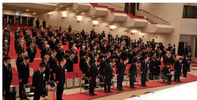
黙とうを捧げる参列者