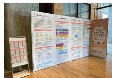
第3回企画展示の様子