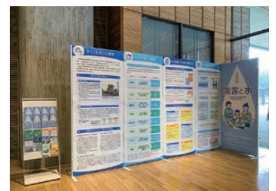
第4回企画展示の様子