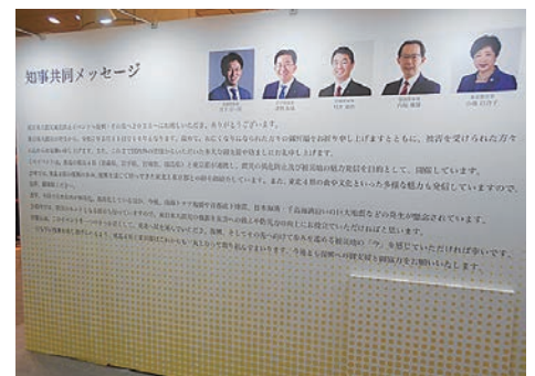
知事共同メッセージ