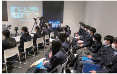
オンライン交流会の様子

令和6年12月14日(土)、岩手県は、陸前高田市の高田松原津波復興祈念公園 国営追悼施設・祈念施設管理棟セミナーラームで、県立山田高校、アメリカ合衆国ハワイ州のヒロ高校、インドネシア共和国アチェ州のバンダ・アチェ第一高校の生徒が、お互いの伝承活動を紹介し、今後の活動について共に考えるオンライン交流会を開催しました。