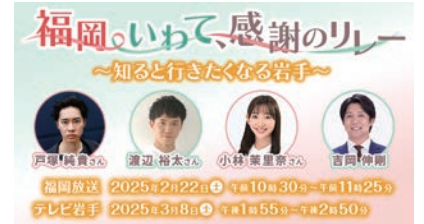
福岡・いわて、感謝のリレー ～知ると行きたくなる岩手～