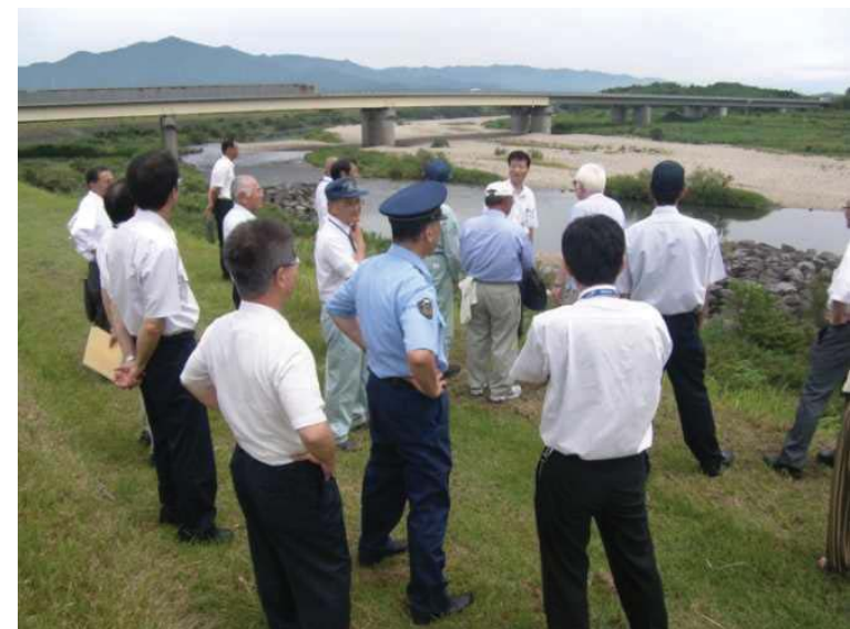
合同巡視 (水難事故防止連絡協議会)