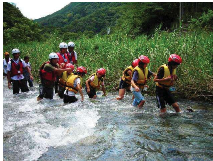
河川水難事故防止訓練 溪流歩き