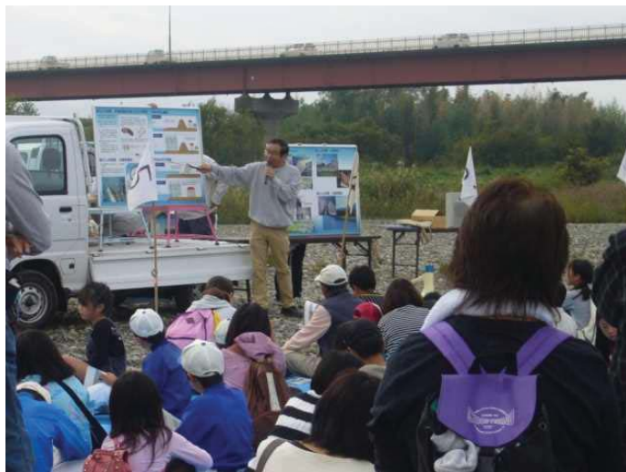
出前講座や安全 講習会の実施

(河川水難事故防止HP) http://www.mlit.go.jp/river/kankyo/anzen/index.html