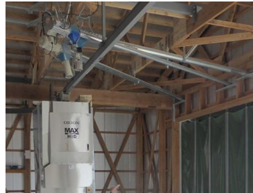
肥育牛の発育に応じた量を 給与する自動給餌機