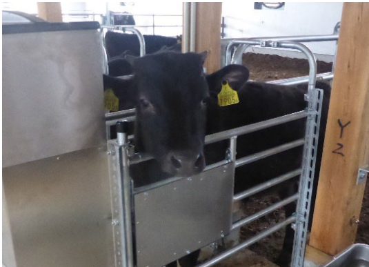
哺乳ロボットによる子牛管理

黒毛和種の繁殖牛約140頭と肥育牛約170頭、日本短角種の繁殖約70頭と肥育約120頭を飼養する県内トップクラスの肉用牛一貫経営。