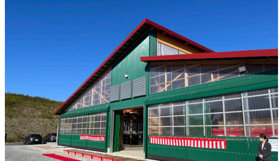
令和6年10月に完成した育成牛舎