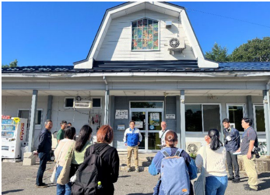
令和6年度の視察の様子

久慈地域の酪農家が設立した株式会社。株主が搾乳した生乳を使った牛乳や乳製品の製造・販売。