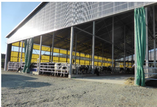
フリーストール牛舎

1度に50頭搾乳できるロータリーパーラーにより、ホルスタイン種経産牛約650頭を飼養する県内トップクラスの酪農経営体。