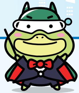
くらし・はたらきマエストロ たしかめたん