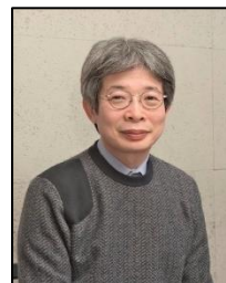
平田 オリザ 芸術文化観光専門職 大学 学長