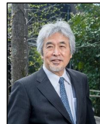
山極 壽一 総合地球環境学 研究所 所長