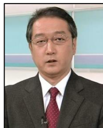
二宮 徹 NHK松山放送局 副局長（元解説委員）