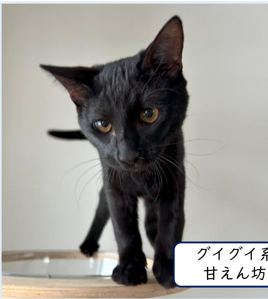
グイグイ系 甘えん坊