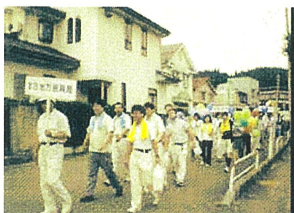
道の日 in 宮古