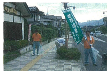
黄金ロードふれあい作戦