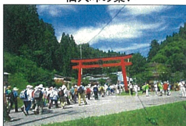
気仙歴史の道を歩いてみよう (竹駒・横田編)