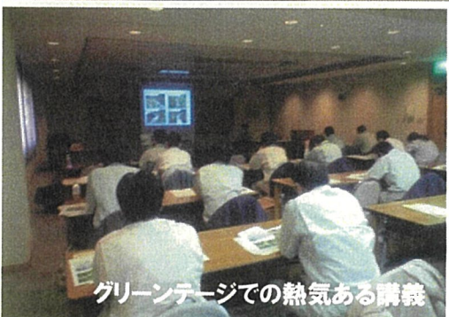
グリーンテージでの熱気ある講義

平成20年12月16日に、葛巻町のふれあい 宿舎「グリーンテージ」と一級河川元町川を会場に第三回いわて多自然川づくり学校が開催されました。