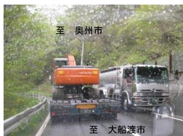
旧国道 397 号通行状況