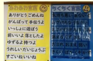
ちくちく言葉には目隠しをする掲示の工夫

4年生の学級では、年度当初に児童からロイロノートでふわふわ言葉とちくちく言葉（言われたら嫌な言葉）を集め、教室内に掲示している。