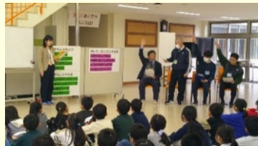
4月 教師による学び合いのモデル提示