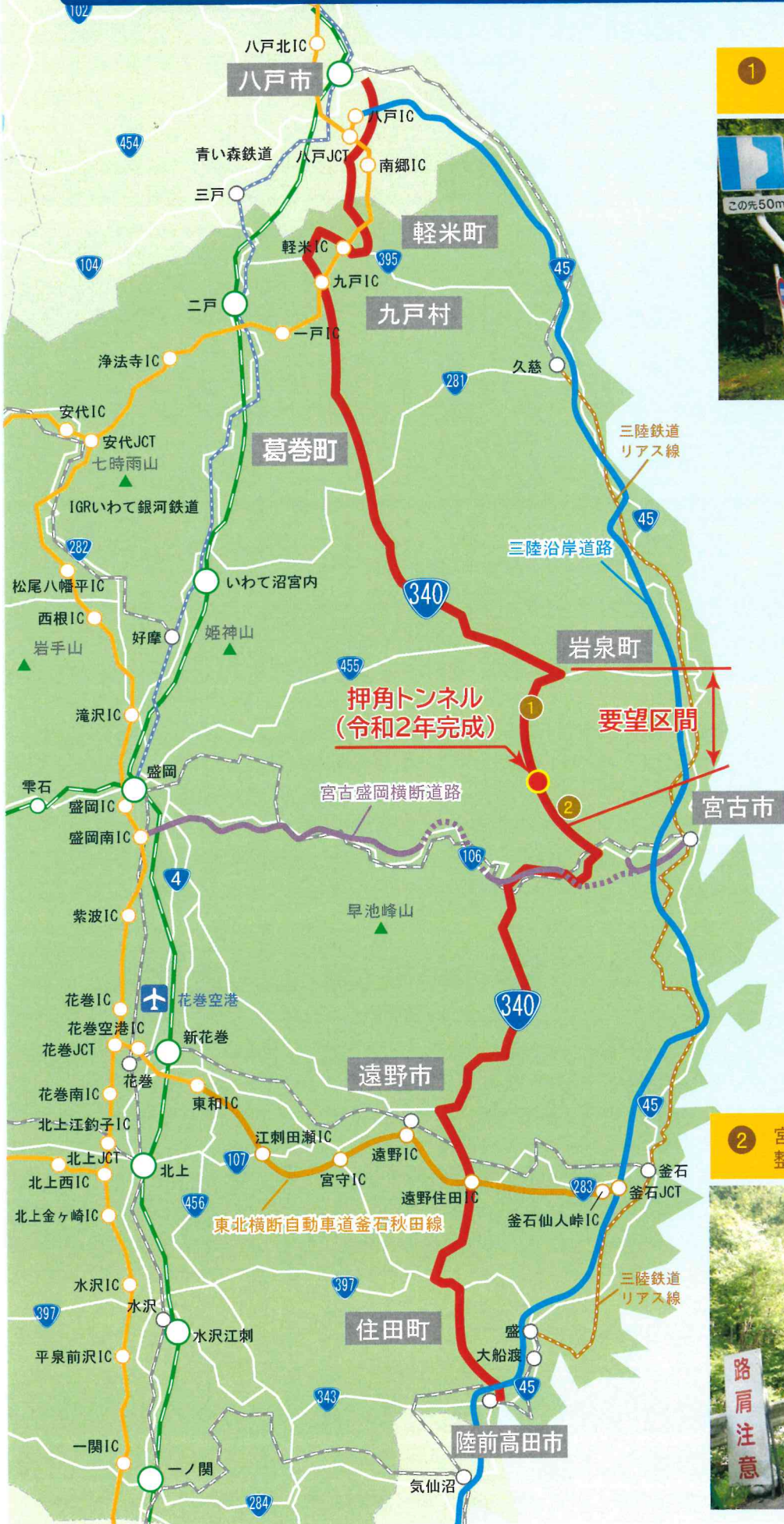
① 岩泉町落合～押角間の事業化区間の整備促進と未整備区間の早期事業化