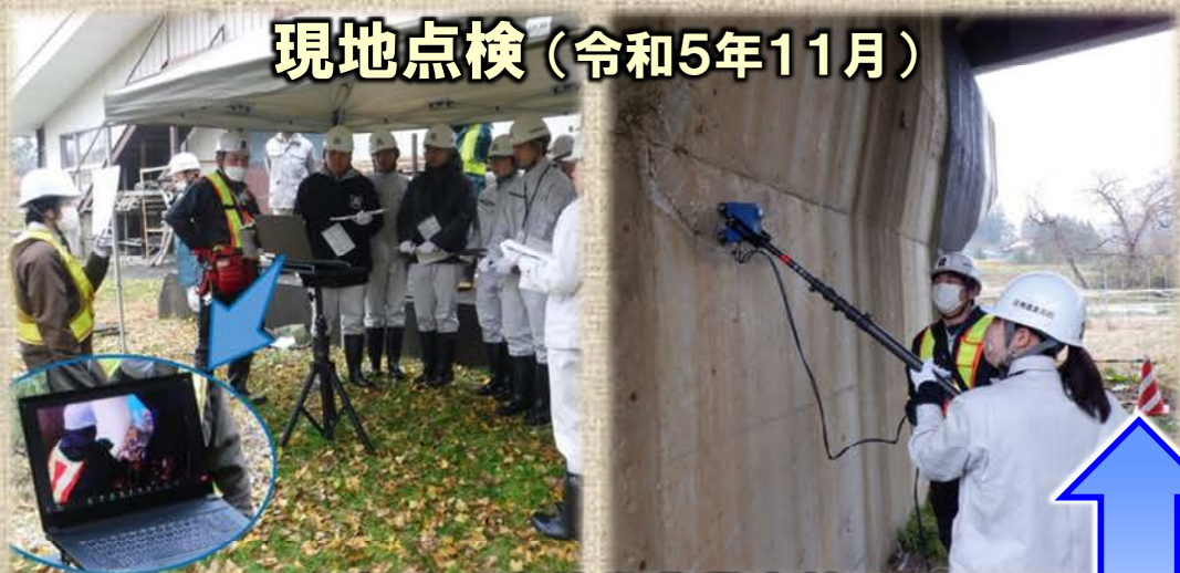
岩手県立花巻農業高校