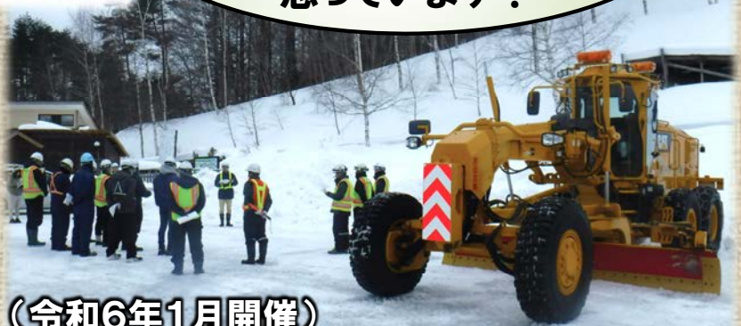
(令和6年1月開催) 久慈地区：平庭高原、冬期通行止県道

今後、辞めていく高齢のオペレーターの方が多くので、若い人達で継いでいければと思っています！