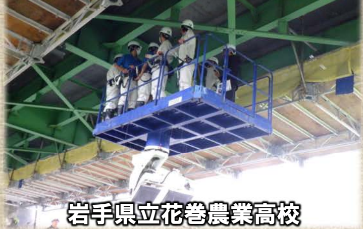
岩手県立花巻農業高校