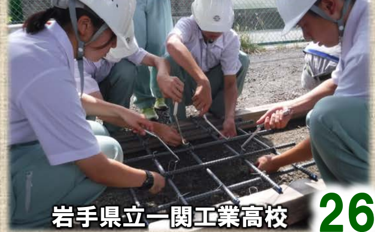
岩手県立一関工業高校