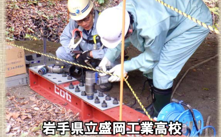
岩手県立盛岡工業高校