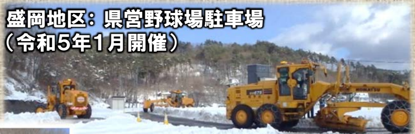
盛岡地区：県営野球場駐車場 (令和5年1月開催)