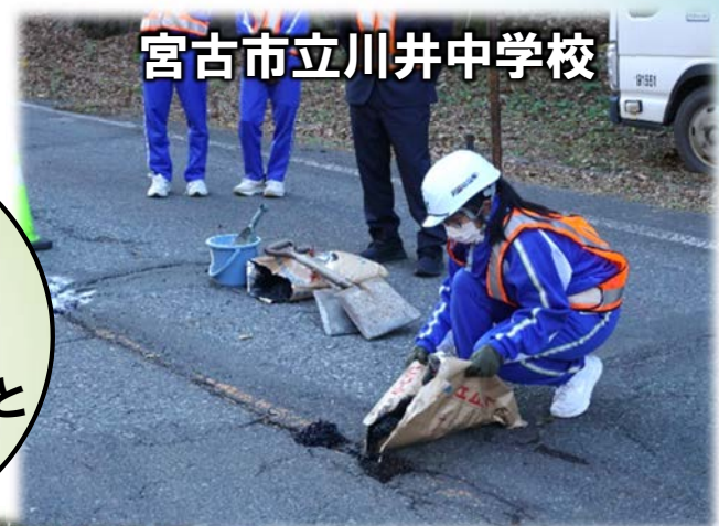
宮古市立川井中学校