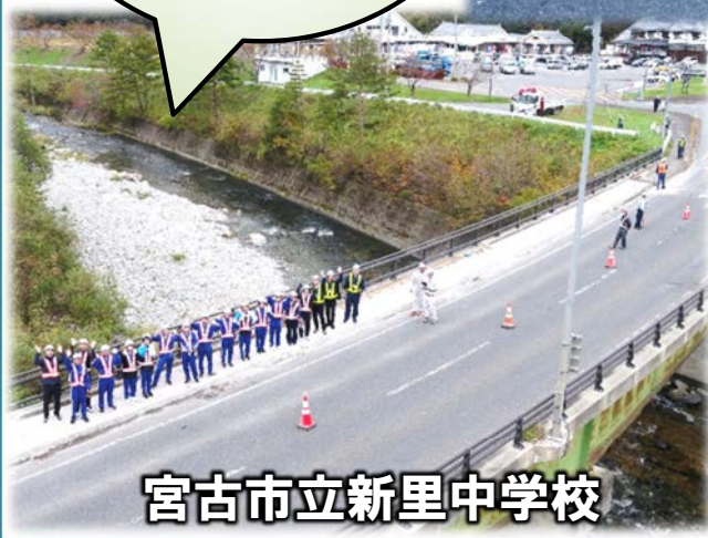
◀ 補修を体験した橋の上で集合写真