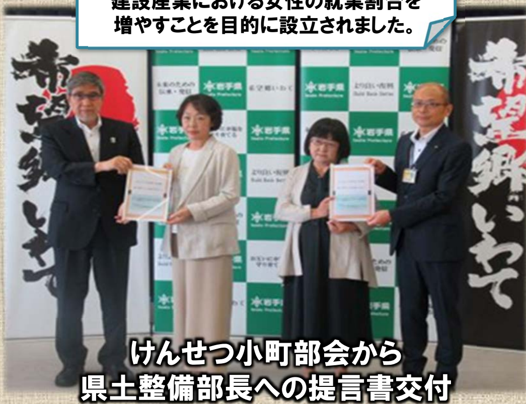
けんせつ小町部会から 県土整備部長への提言書交付

いわて女性の活躍促進連携会議に設置された5つの部会のうちのひとつ。 建設産業の担い手確保のため、建設産業における女性の就業割合を増やすことを目的に設立されました。