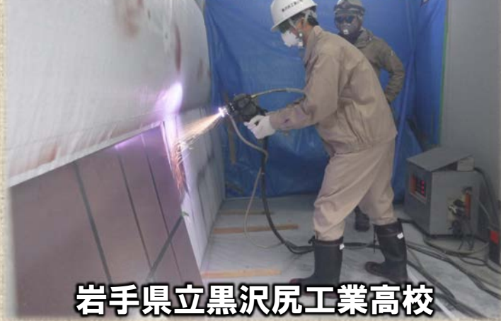
岩手県立黒沢尻工業高校