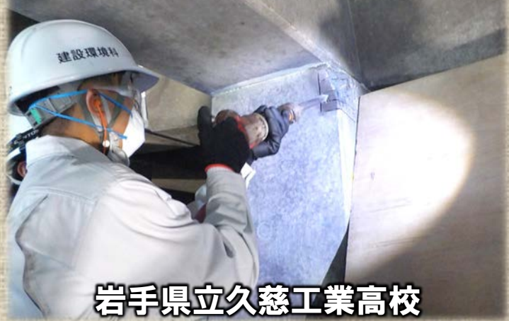
岩手県立久慈工業高校