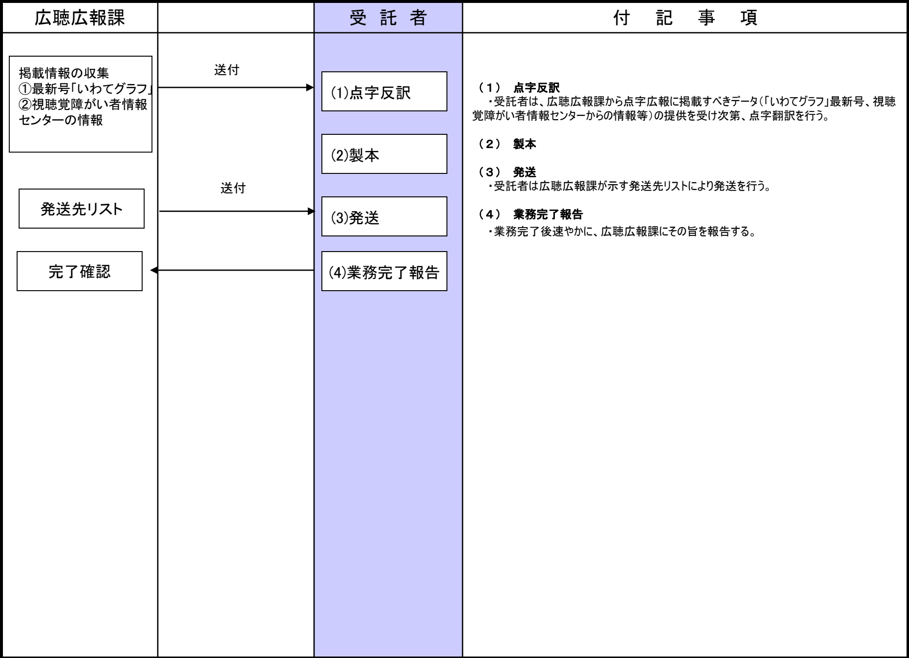
【別記②:「点字広報いわて」業務工程】